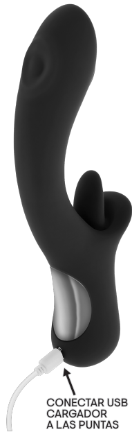
CONECTAR USB CARGADOR A LAS PUNTAS

INSTRUCCIONES DE CARGA: Se recomienda cargar este juguete antes del primer uso. Para cargar, conecte el enchufe USB a una fuente de alimentación en un extremo y el cargador magnético a las clavijas ubicadas en la parte posterior de la base del juguete. Los cargos tardarán unos 90 minutos en completarse. La luz indicadora parpadeará mientras el dispositivo se está cargando y permanecerá constante cuando el juguete esté completamente cargado. La carga dura aproximadamente 50 minutos de juego con un uso promedio. Este juguete funciona a un nivel de sonido de menos de 55 dB con una batería de litio recargable de 700 mAh de 3.7 V a 4.2 V.