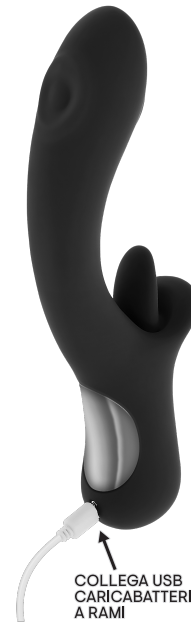
COLLEGA USB CARICABATTERIE A RAMI

ISTRUZIONI PER LA RICARICA: Si consiglia di caricare questo giocattolo prima del primo utilizzo. Per caricare, collegare la spina USB a fonte di alimentazione a un'estremità e il caricabatterie magnetico sui pin situati sul retro del base del giocattolo. Il completamento della ricarica richiederà circa 90 minuti. La spia lampeggerà mentre il dispositivo è in carica e rimane costante quando il giocattolo è completamente carico. La carica dura circa 50 minuti di gioco con un utilizzo medio. Questo giocattolo funziona con un suono livello inferiore a 55 dB con una batteria al litio ricaricabile da 700 mAh a 3.7 V - 4.2 V.