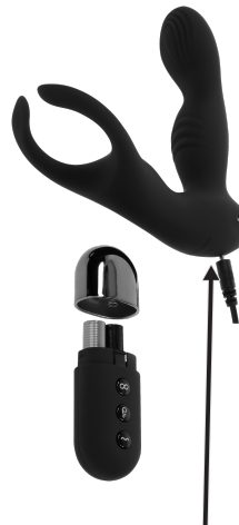
EINFÜGEN LADEGERÄT HIER

LADLEANLEITUNG: Es wird empfohlen, dieses Spielzeug vor dem ersten Gebrauch aufzuladen. Zum Aufladen schließen Sie den USB-Stecker an eine Stromquelle und das andere Ende an den Ladeanschluss unter der Basis des Spielzeugs an. Der erste Ladevorgang dauert etwa 2 Stunden und weitere Ladevorgänge dauern etwa 90 Minuten. Die Kontrollleuchte am Spielzeug blinkt, während das Gerät aufgeladen wird, und leuchtet dauerhaft, wenn es vollständig aufgeladen ist. Der Ladevorgang reicht für etwa 90 Minuten Spielzeit auf der niedrigsten Vibrationsstufe und etwa 60 Minuten auf der höchsten Stufe. Dieses Spielzeug arbeitet mit einem Schallpegel von 50 dB und einer Lithiumbatterie mit 3.7 V.