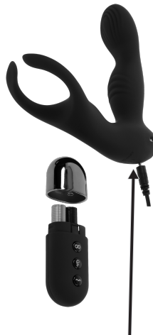
INVOEGEN OPLADER HIER

OPLAADINSTRUCTIES: Het wordt aanbevolen om dit speelgoed voor het eerste gebruik op te laden. Om op te laden sluit u de USB-stekker aan op een voedingsbron en het andere uiteinde op de oplaadpoort onder de basis van het speelgoed. Het eerste opladen duurt ongeveer 2 uur en het daaropvolgende opladen duurt ongeveer 90 minuten. Het indicatielampje op het speelgoed knippert terwijl het apparaat wordt opgeladen en blijft branden als het volledig is opgeladen. Opladen duurt ongeveer 90 minuten speeltijd op het laagste trillingsniveau en ongeveer 60 minuten op het hoogste niveau. Dit speelgoed werkt op een geluidsniveau van 50 dB met een lithiumbatterij van 3.7 V.