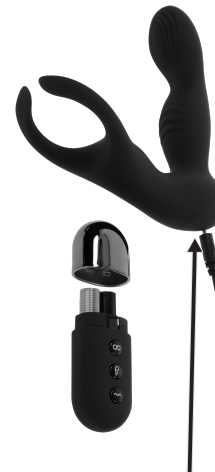
ВСТАВЛЯТЬ ЗАРЯДНОЕ УСТРОЙСТВО ЗДЕСЬ

ИНСТРУКЦИЯ ПО ЗАРЯДКЕ: Перед первым использованием рекомендуется зарядить игрушку. Для зарядки подключите USB-штеккер к источнику питания, а другой конец — к зарядному порту под основанием игрушки. Первоначальная зарядка займет около 2 часов, а последующие зарядки — около 90 минут. Световой индикатор на игрушке будет мигать, пока устройство заряжается, и горит постоянно, когда устройство полностью заряжено. Зарядка хватает примерно на 90 минут игрового времени на самом низком уровне вибрации и около 60 минут на максимальном уровне. Это игрушка работает с уровнем звука 50 дБ от литиевой батареи напряжением 3,7 В.